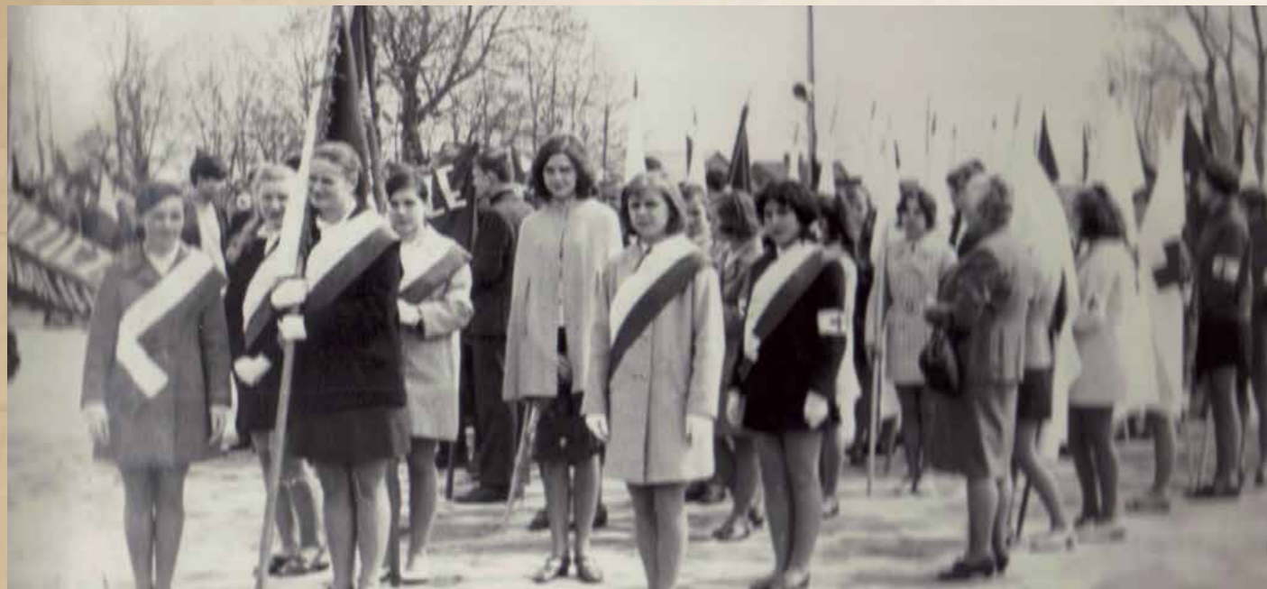
Rok 1969, Szkoła Podstawowa Nr 2

W okresie PRL Święto Pracy przypadające 1 maja nierozdzielnie było związane z pochodami pierwszomajowymi. Obchodzone hucznie miało być przeciwagą dla 3 Maja, o którym z kolei oficjalnie nie mówiono.