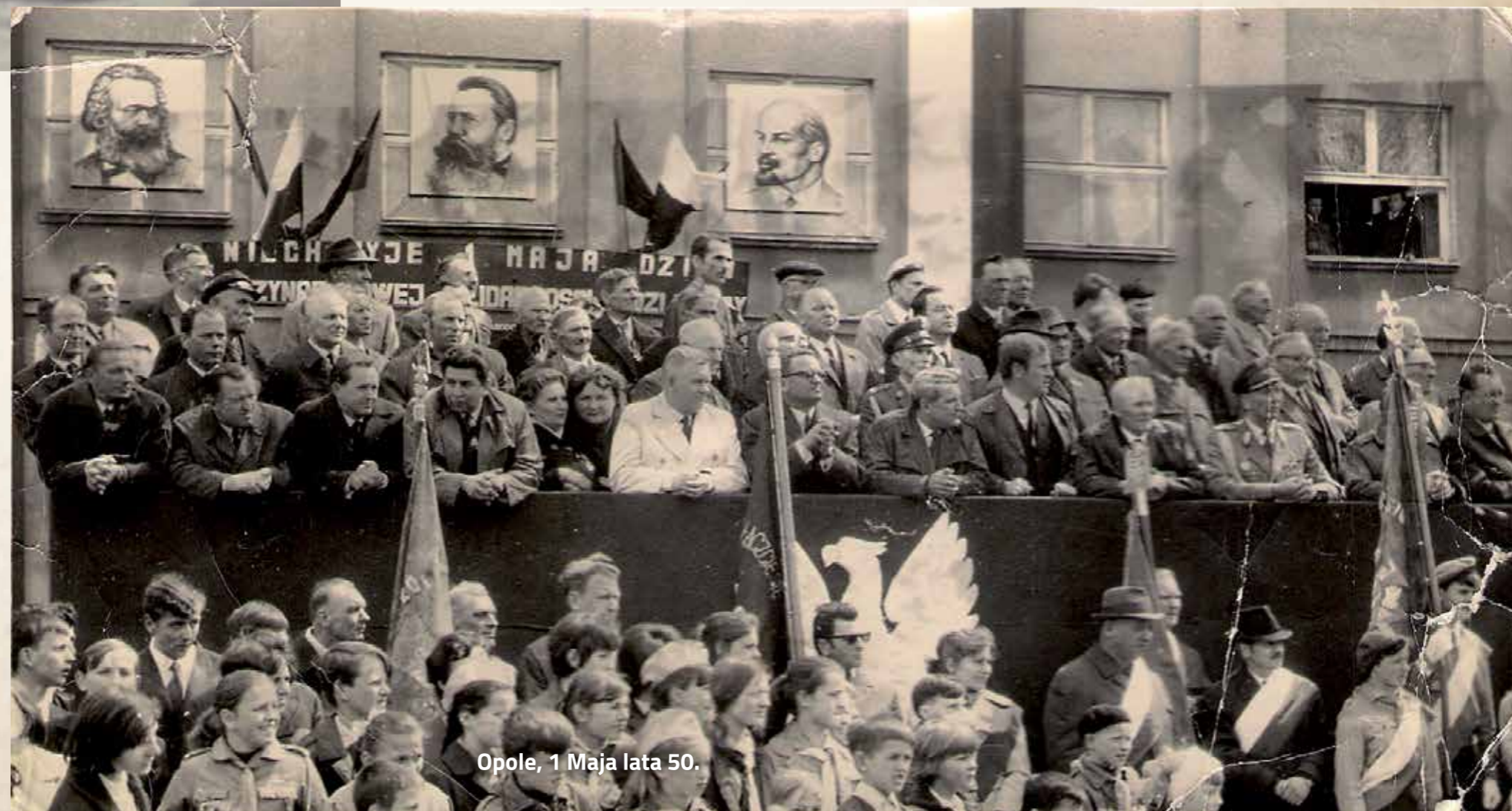
Opole, 1 Maja lata 50.

Dla wielu Polaków 1 maja był dniem podwójnym: z jednej strony oficjalnym, narzuconym świętem propagandy, a z drugiej - dniem wolnym, który starano się wykorzystać na własne, prywatne cele po spełnieniu obywatelskiego „obowiązku”.