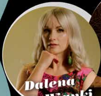
Dalena & PoWianki

• PRADZIEJEsię! – immersyjna podróż do świata dawnych epok