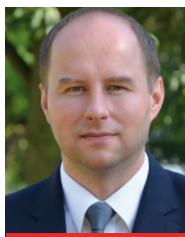
Burmistrz Opola Lubelskiego: